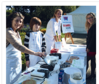
Fördervereine haben sich zu gängigen Instrumenten des Fundraisings entwickelt. Ihre Aktionen eignen sich gut, um Spenden zu sammeln.

ins Leben gerufen. Die Besonderheit: Sie nutzen das Fundraising nicht für eigene Projekte, sondern unterstützen benachteiligte Menschen so-