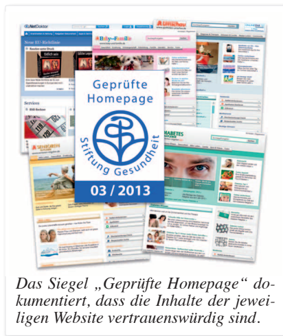
Das Siegel „Geprüfte Homepage“ dokumentiert, dass die Inhalte der jeweiligen Website vertrauenswürdig sind.